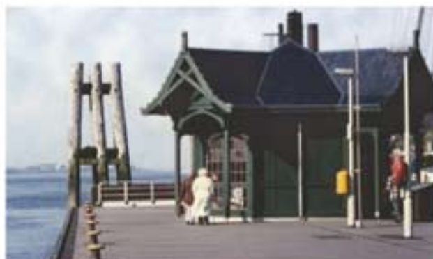
Die „Döns“, der Nachbau eines historischen Wartehäuschens